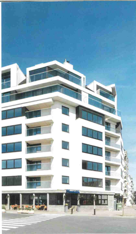
Het gebouw uit de jaren vijftig onderging een metamorfose. In een extra bouwlaag kwamen 7 stijlvolle nieuwe penthouses.

Vestio staat voor Vangronsveld & Somers, een autoriteit in de ontwikkeling van residentiële vastgoedprojecten op toplocaties in het binnenland en aan de Belgische kust. Residentie Esmeralda in Knokke is één van de nieuwste parels aan de kroon van de Limburgse vastgoedpromotor.